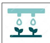
Goutte à goutte