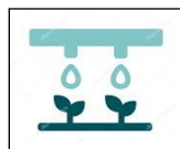
Goutte à goutte